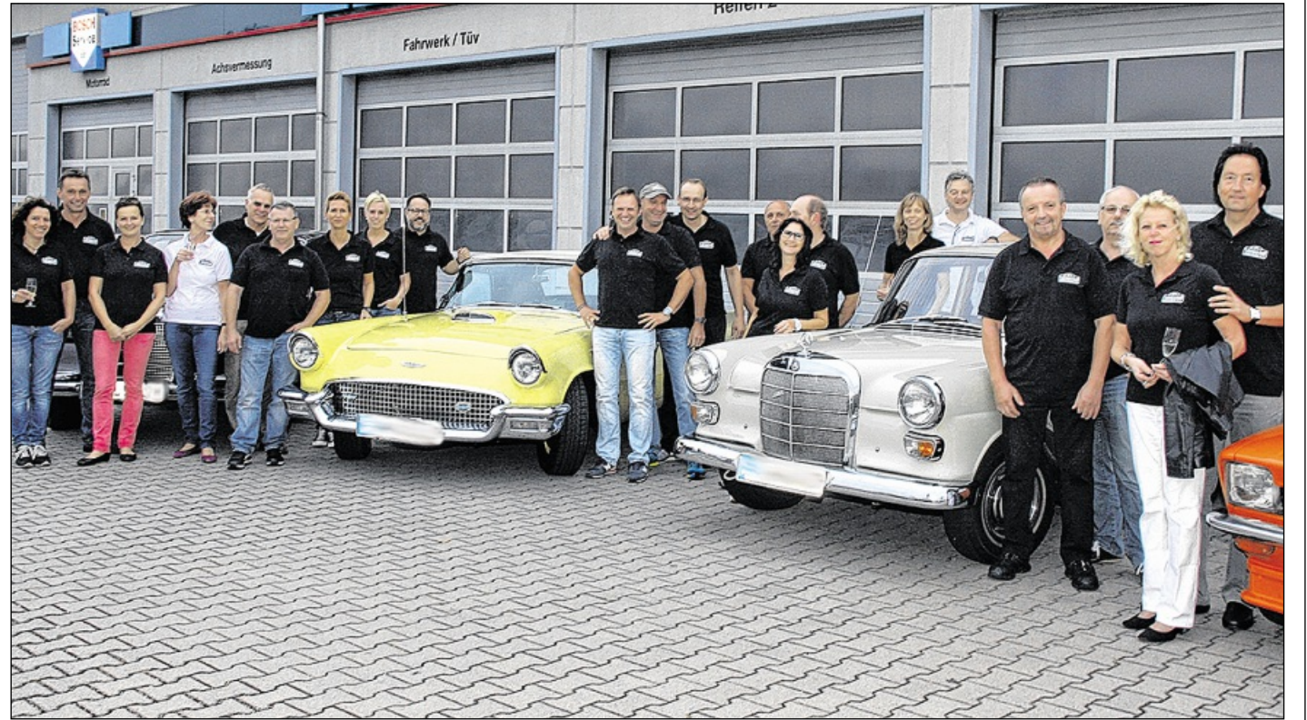
AUF GROSSE FAHRT ging es für den 1. Oldtimer Club Waghäusel. Einige Mitglieder sind unterwegs zum Gardasee, die Fahrt führt nur über Landstraßen bis ans Ziel.